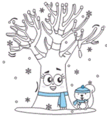
(۴) فصل زمستان