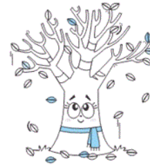
(۳) فصل پاییز

۵۸- در کدام گزینه، غلط املائی وجود دارد؟