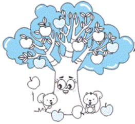
(۲) فصل تابستان

«بر شاخه‌های درختان میوه، آن قدر سیب گلگون و گلابی و میوه‌های دیگر آویخت که شاخه‌ها تاب نیاوردند.»