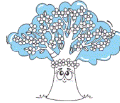
(۱) فصل بهار