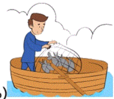
(ماهی گیری) (۱)