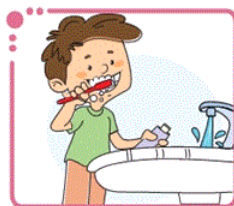
(مسواک زدن با شیر آب باز) (۴)